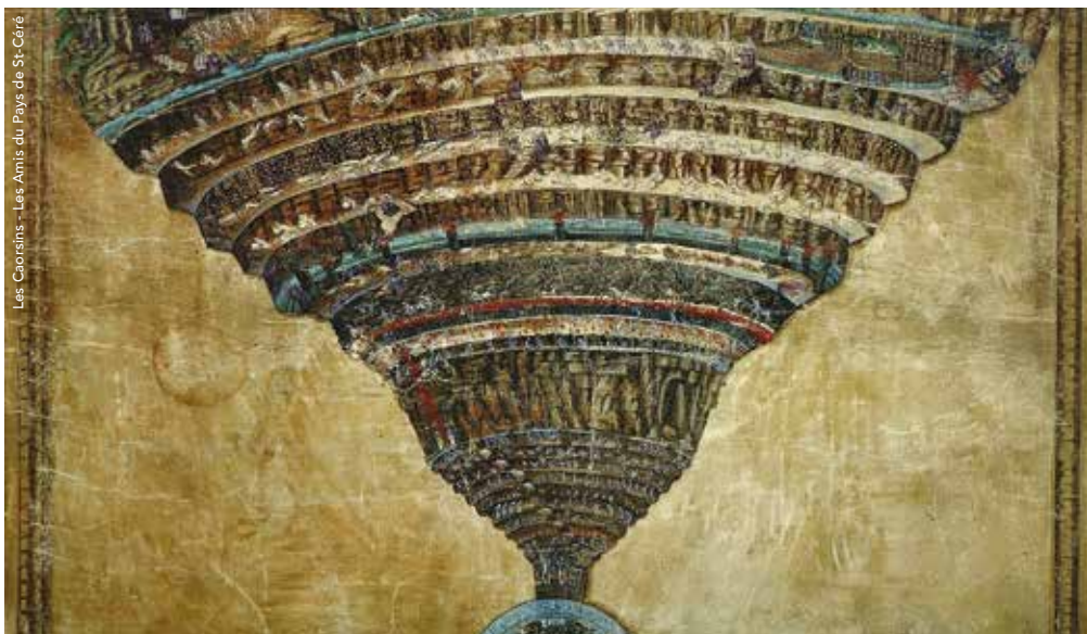
Les Caorsins - Les Amis du Pays de St-Céré