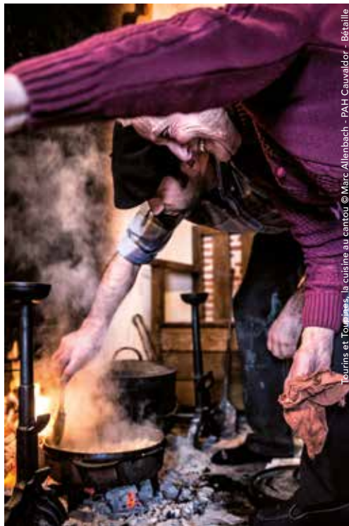
Tourins et Toupines, la cuisine au cantou

Goudou Haut. Tout public. Libre et gratuit.