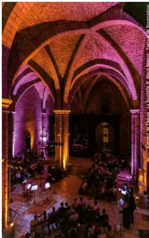
Concert de Pâques - La Sportelle © Alexis Mestre - Festival de Rocamadour

OÙ Basilique Saint-Sauveur. Tout public. 0 à 20€.