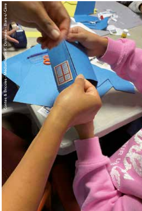
Contes & Bricoles - Médiathèque R. Doisneau - Biars-s/-Cère

94 av. de la République. Dès 4 ans. Gratuit. Sur inscription.