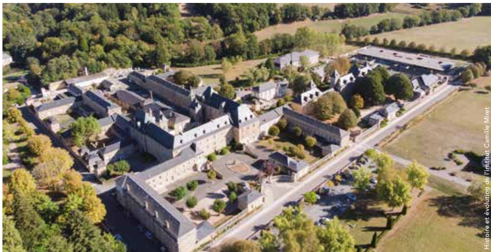
Histoire et évolution de l'Institut Camille Miret