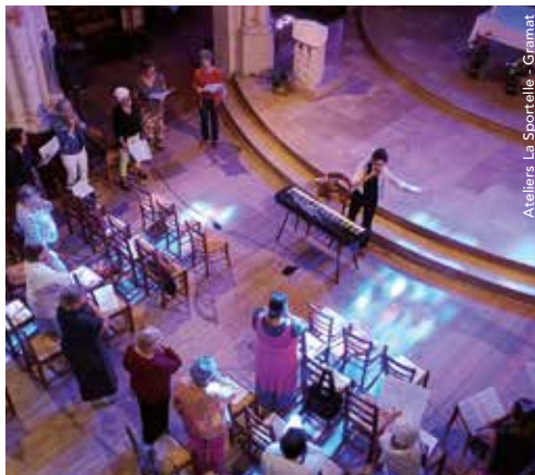
Ateliers La Sportelle - Gramat

10 rue de la Halle. Adulte. Gratuit. 14h30-16h30