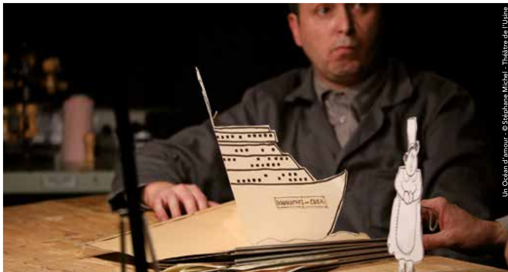
Un Océan d'amour - © Stéphane Michel - Théâtre de l'Usine

Cinéma L'Uxello, place Cap Del Let. Tout public. 5€. Verre de l'amitié offert. Sur inscription.