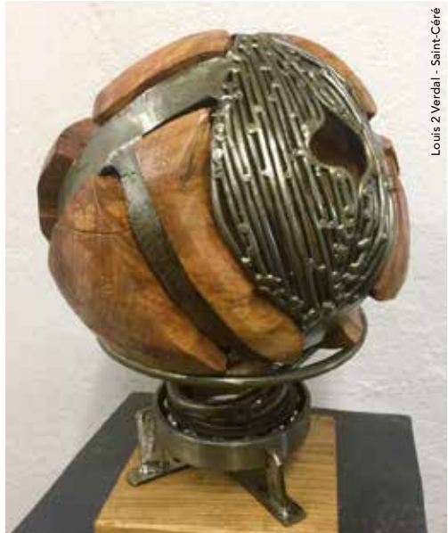
Louis 2 Verdal - Saint-Céré

OÙ Lieu dit Bagadou Bas (suivre les panneaux Vitrail d'art). Tout public. Gratuit. Sur rdv ou si présence dans l'atelier. 10h-18h.